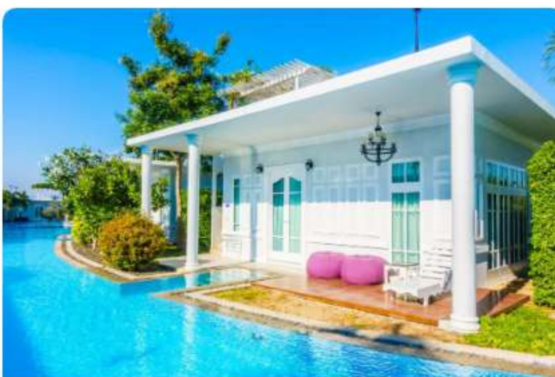
Nîmes Projet De Madrick Budget 420 000€ - Loyer 4650€ En savoir plus