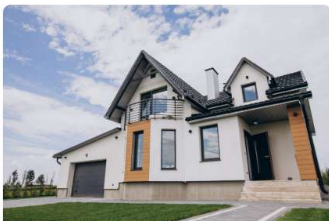
Nîmes Projet De Philippe Budget 420 000€ - Loyer 4650€ En savoir plus