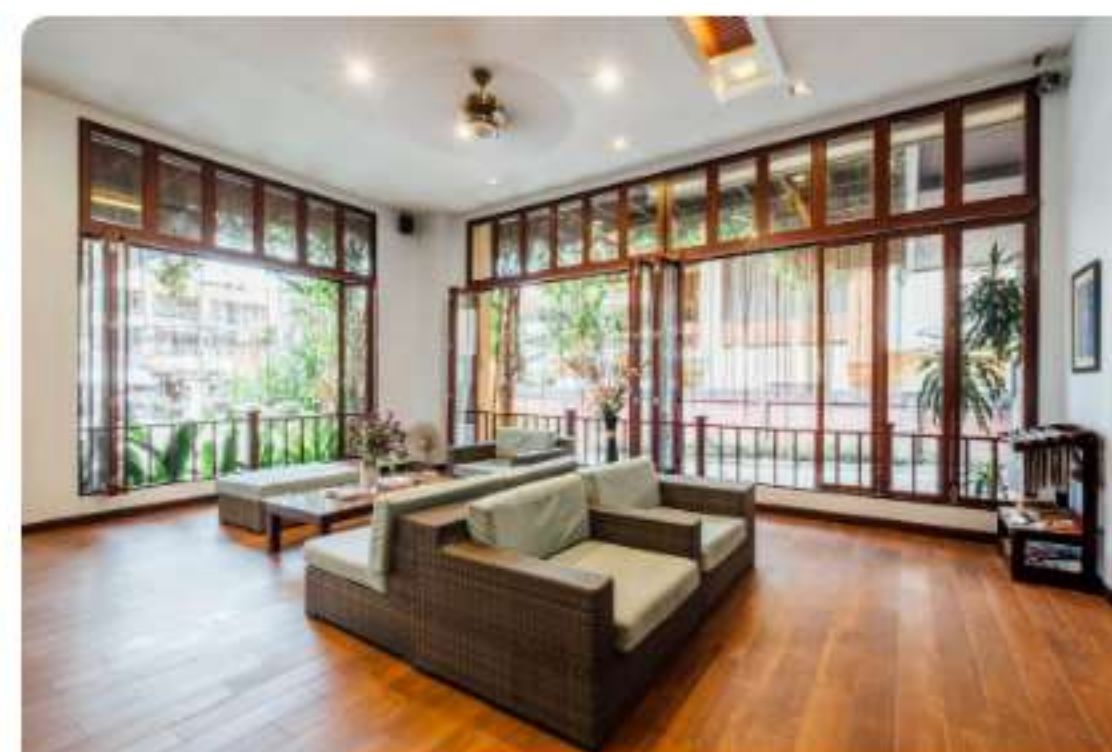
Nîmes Projet D'Isabelle Budget 420 000€ - Loyer 4650€ En savoir plus